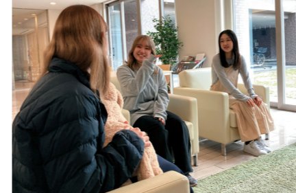
1階ラウンジに設置されているソファで友人とおしゃべりガラス張りで明るく、くつろげる空間です