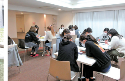
ラウンジで「履修相談会」。履修登録はもちろん大学生活における様々な不安や疑問を上級生に相談しました