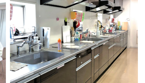
キッチンにはIH調理器、オーブンレンジ、トースターが備え付け毎朝お弁当をつくる館生も