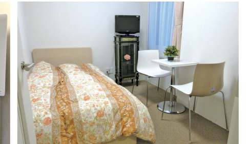
お母さんや姉妹が泊まれるゲストルームは1泊3,000円