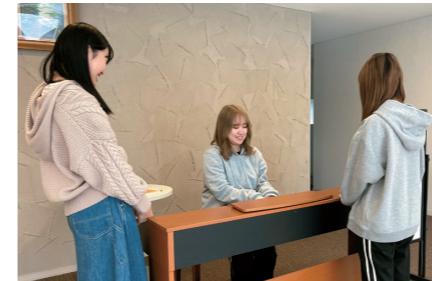
1階ラウンジに新設された電子ピアノ自由に弾くことができます