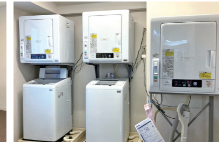
ランドリールームの利用は無料乾燥機があるので、雨が降いても安心